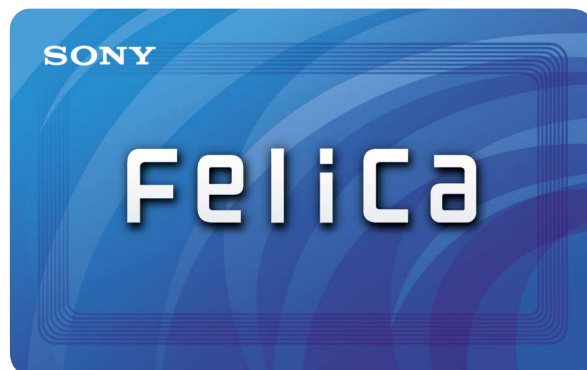
カードの印刷はサンプルです。

RC-S880は、これらの多様なニーズにお応えできる大容量、高セキュリティ、高機能な次世代FeliCaカードです。